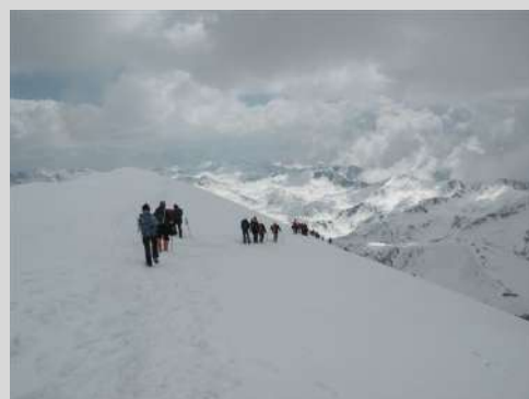
Povratak sa vrha

Pauza na vrhu je potrajala. Vreme sunčano bez vetra pa se nikome ne ide sa vrha. Pogled prelep na snežne vrhove Pirina. Nakon fotografisanja, istom stazom se vraćamo do doma. Zaslužili smo pauzu. Brzo stižemo do autobusa pa pravo u hotel. Naveče isti provod.