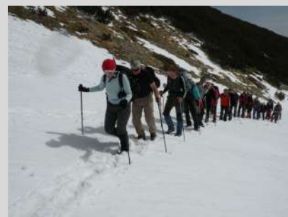
Detalj sa uspona na Poležan