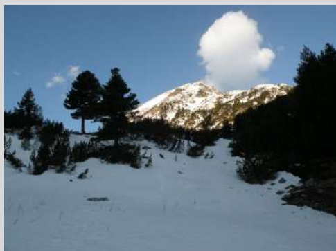
Sunce je najavljivalo lep dan

Narednog dana kređemo ranom zorom ka Vihrenu, najvišem vrhu Pirina. Ponovo dolazimo autobusom do jučerašnjeg parkinga polazne tačke za današnji uspon. Za manje od dva sata savladali smo oko 300m visine i prepešačili oko 7km. Bilo je to dobro zagrevanje za ono što predstoji. Napravili smo kratku pauzu u domu Vihren (1950m). Od doma je strmiji uspon jedva vidljivom zasneženom stazom. Po koja markacija izroni iz snega. To nam daje potvrdu da smo na pravom putu. Pojavilo se i sunce. I danas će biti lep, sunčan dan - idealan za planinarenje.