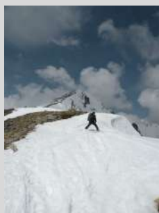
Skijanje sa vrha