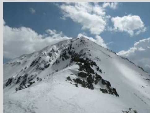
Falilo je još malo

Narednog dana kređemo ranom zorom ka Vihrenu, najvišem vrhu Pirina. Ponovo dolazimo autobusom do jučerašnjeg parkinga polazne tačke za današnji uspon. Za manje od dva sata savladali smo oko 300m visine i prepešačili oko 7km. Bilo je to dobro zagrevanje za ono što predstoji. Napravili smo kratku pauzu u domu Vihren (1950m). Od doma je strmiji uspon jedva vidljivom zasneženom stazom. Po koja markacija izroni iz snega. To nam daje potvrdu da smo na pravom putu. Pojavilo se i sunce. I danas će biti lep, sunčan dan - idealan za planinarenje.