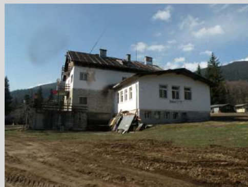
Hiža "Goce Delčev"

Na uskrsmo krenuli iz hotela autobusom do planinarskog doma Goce Delčev, polazne tačke za uspon na Poležan.